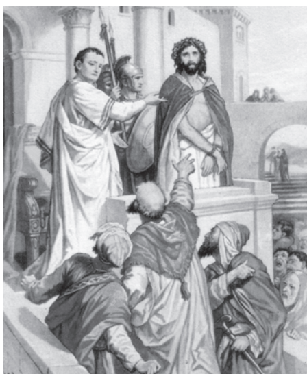
Исус на съд пред Пилат

"А когато се мина съботата, Мария Магдалина, Мария, Якововата майка, и Саломия купиха аромати, за да дойдат и го помажат. И в първия ден на седмицата дойдоха на гроба много рано, когато изгря слънцето. И казваха помежду си: Кой ще ни отвори камъка от гробната врата? Защото беше твърде голям. А като повдигнаха очи, видяха, че камъкът бе отвален. И като влязоха в гроба, видяха, че един юноша седи отлясно, облечен в бяла одежда; и много се удивиха. А той им каза: Недейте се удивлява, вие търсите Исуса Назарянина, разпнатия. Той възкръсна; няма Го тука, ето мястото, където Го положиха. Но идете, кажете на учениците Му и на Петър, че отива преди вас в Галилея; там ще Го видите, както ви каза. И те излязоха и побягнаха от гроба, понеже трепет и ужас бяха ги обзели; и никому не казаха нищо, защото се бояха."