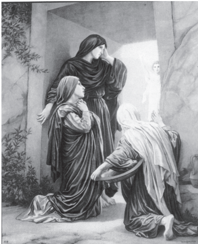
Няма Го тук! Той възкръсна!

ка от дявола). И наистина, под девица се разбира Ева, защото тя не познаваше мъж. Дървото беше забраната, отправена към Адам, а смъртта - неговото осъждане. Ето отново девицата, дървото и смъртта станаха образи на победата: вместо Ева там, тук ще е Мария; вместо дървото за познаване на добро и зло, тук е кръстното дърво; вместо смъртта на Адам - смъртта на Христос. Виждаш ли как дяволът с онова, с което беше победил, със