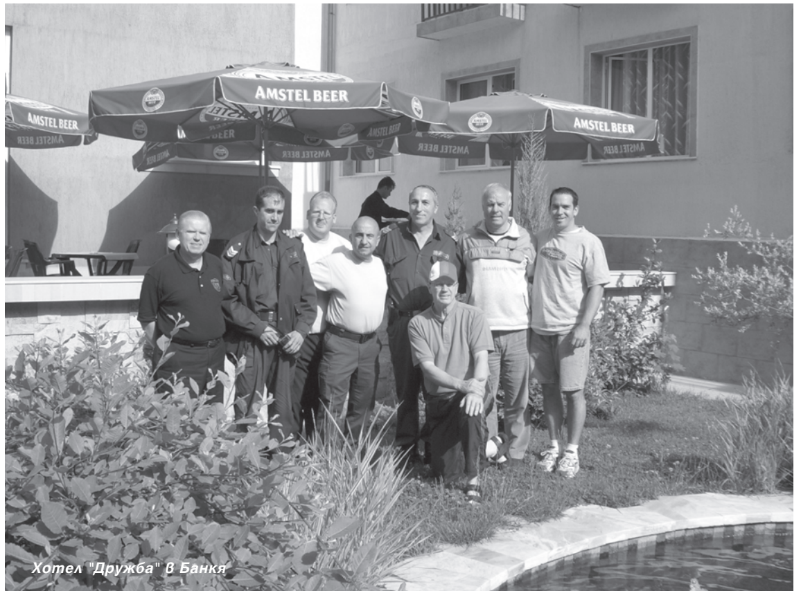
Хотел "Дружба" в Баня