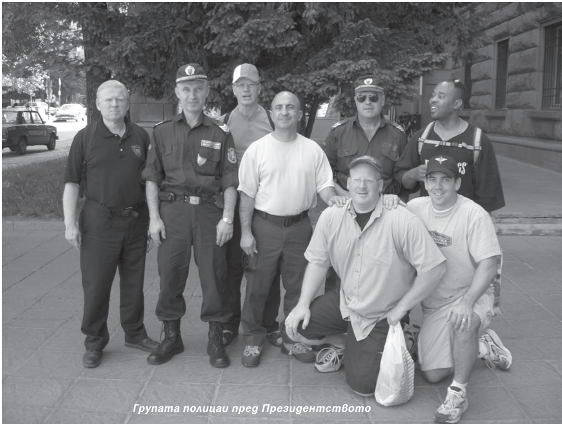
Група полицаи пред Президентството

Емери видял Сатана с меч в ръка, как започнал да пробужда неговите приятели. На сън той извикал: "Господи, помогни ми!" След това се събудил, отворил очи и започнал горещо да се моли за прощение на греховете си в