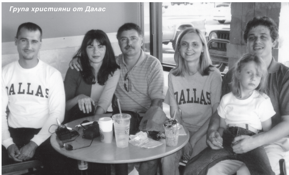
Група християни от Далас

И така, изцелението е в резултат на вяра. Моли се с простичка молитва и приеми твоето изцеление: "Господи Исусе, Ти си, Който прощаваши всичките ми беззакония и изцеляваш всичките ми болести. Ти взе на кръста на