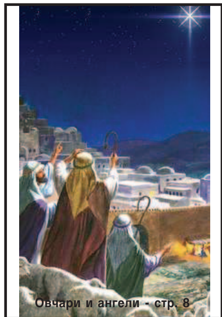
Овчари и ангели - стр. 8