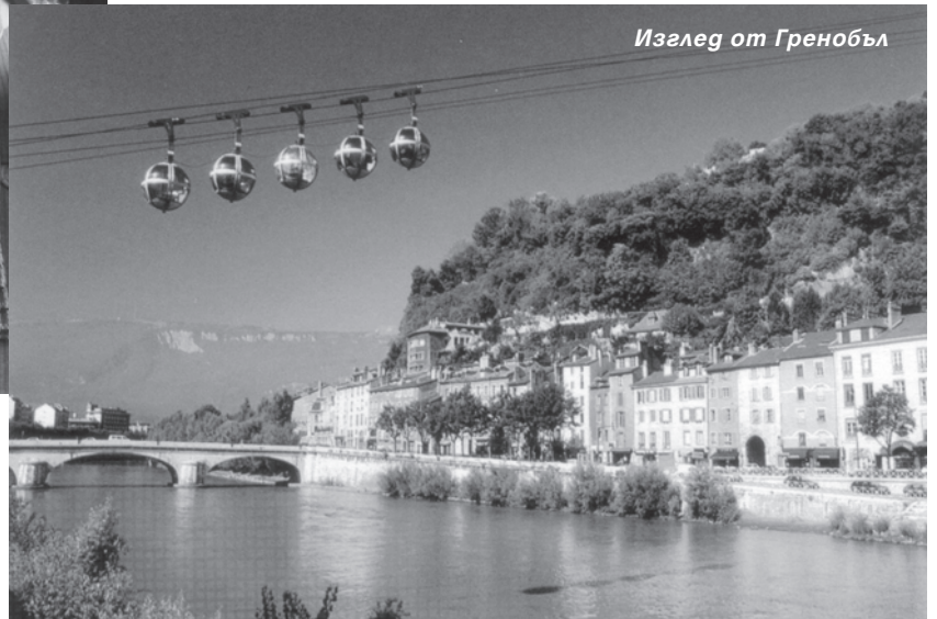
Изглед от Гренобъл

че, да търсят препитание. Църквата им помага. В една от сградите им приготовили апартамент, скромно, но с всичко необходимо.