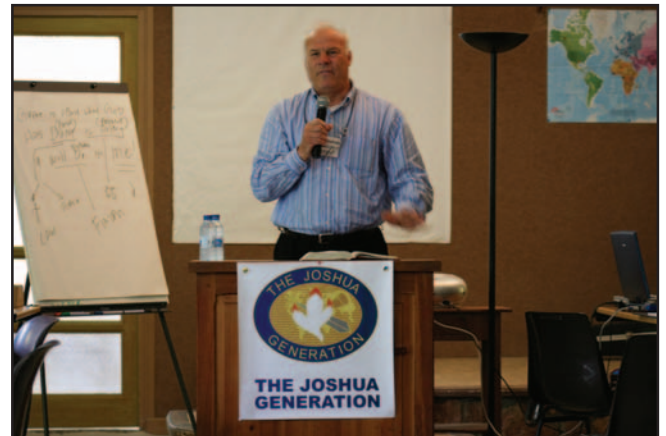
Епископ Милчо Тотеv

Участниците в 8-мия интернационален симпозиум