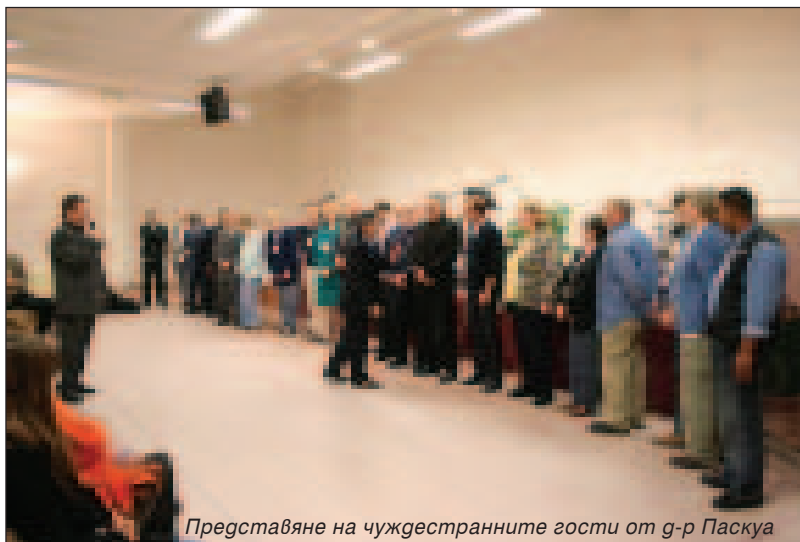
Представяне на чуждестранните гости от г-р Паскуа