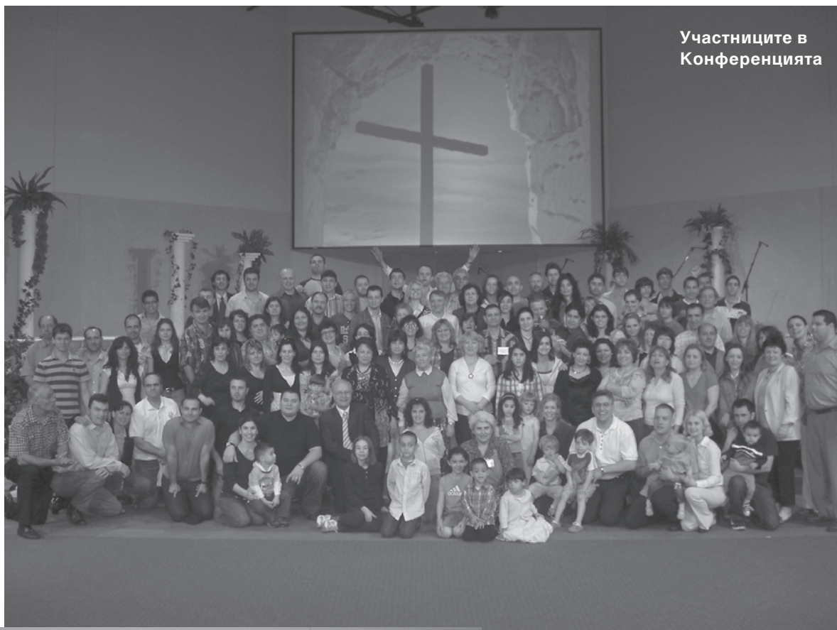
Участниците в Конференцията