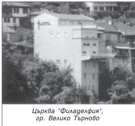
Църква "Филаделфия", гр. Велико Търново

Канарата Исус обаче удря не само световните царства. Тя удря и непокорните човеци. Някога фарисеите и садукееите се опитаха да изкушат Господа Исуса Христа. И днес има човеци, които не желаят да повярват, че Той е обещаният Избавител на Израиля. И днес има човеци, които не вярват, че Исус е Божий Син и че Той може да спасява от греха. Обаче, на всички тези люде Господ Исус казва, че Той е канара . „И който падне в непокорството си върху тази канара, ще се смаже; а върху когото падне тази канара, ще го пръсне“ (Мат. 21:44).