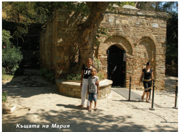
Къщата на Мария