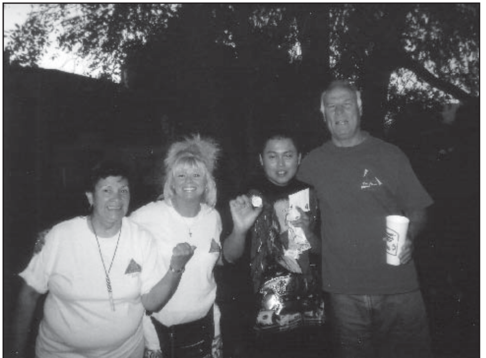
Този китаец прие Христа на улицата.

Моята майка също беше болна. Имаше заболяване на белите дробо-