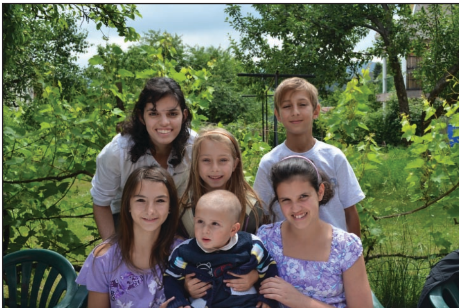
Родът на праведния благословен

„Но Той е на един ум, и кой може да Го отвърне? И каквото желае душата Му, това прави.“ (Йов 23:13) „Намеренията на Господа стоят твърди до века, мислите на сърцето Му из