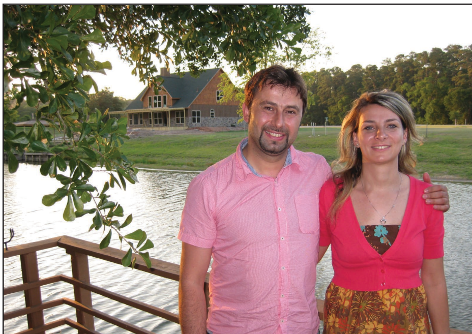
Изглед от Хънтсвил

след нас, ние ще отворим вратите.“ Така ние вече бяхме вътре. Намерихме къщата. Нямахме жи-