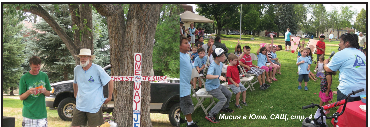
Мисия в Юта, САЩ, стр. 4

“Вие трябва да проповядвате прод. на стр. 2 ➔