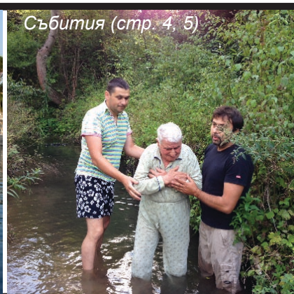
Събития (стр. 4, 5)