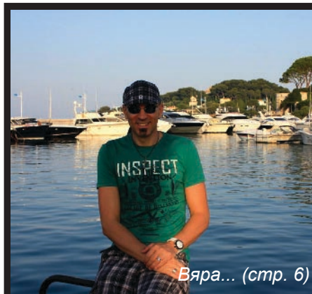
Вяра... (стр. 6)