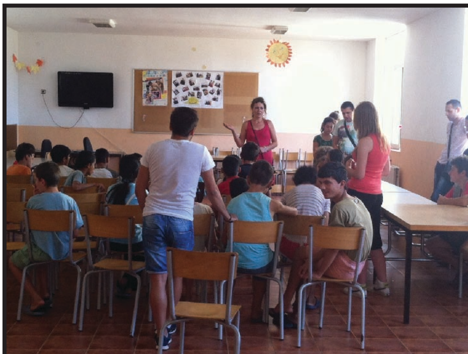
Общение в една от класните стаи на училището