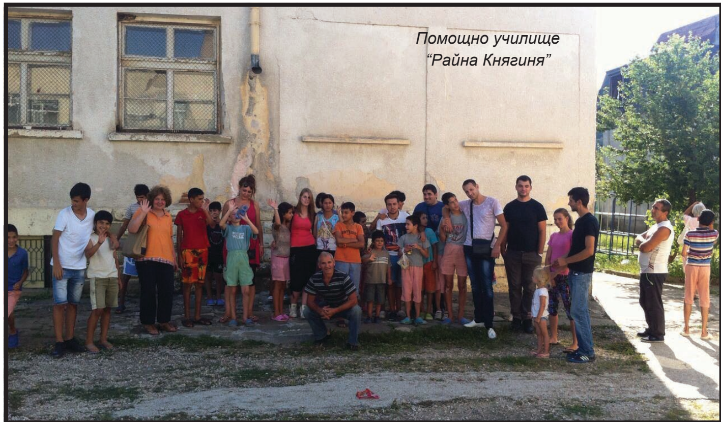
Помощно училище "Райна Княгиня"