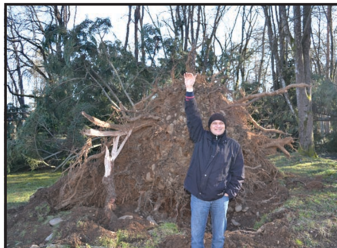
Едно от вековните дървета, изтръгнато от вятъра по време на бурята т.г. в гр. Вършец!