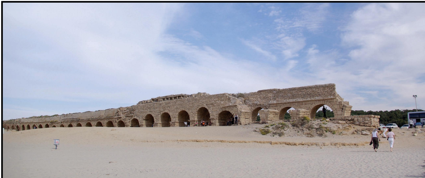
В Израел се виждат контурите на пристанището Кесария

блем да извика който и да е, който Бог му кажеше. Но апостол Петър имаше проблем да отиде в дома на езичника Корнилий. Господ понякога използва някой друг, за да реши нашия проблем, за да пречупи нашите предразсъдъци. Когато Той изпрати ангела, веднага след това