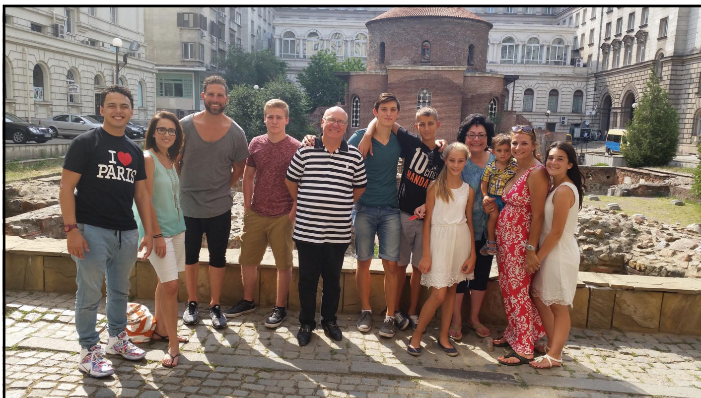
Разходка с гостите в красивата ни столица София

1320 София, Банкя, ул. “Кирил и Методий” 16