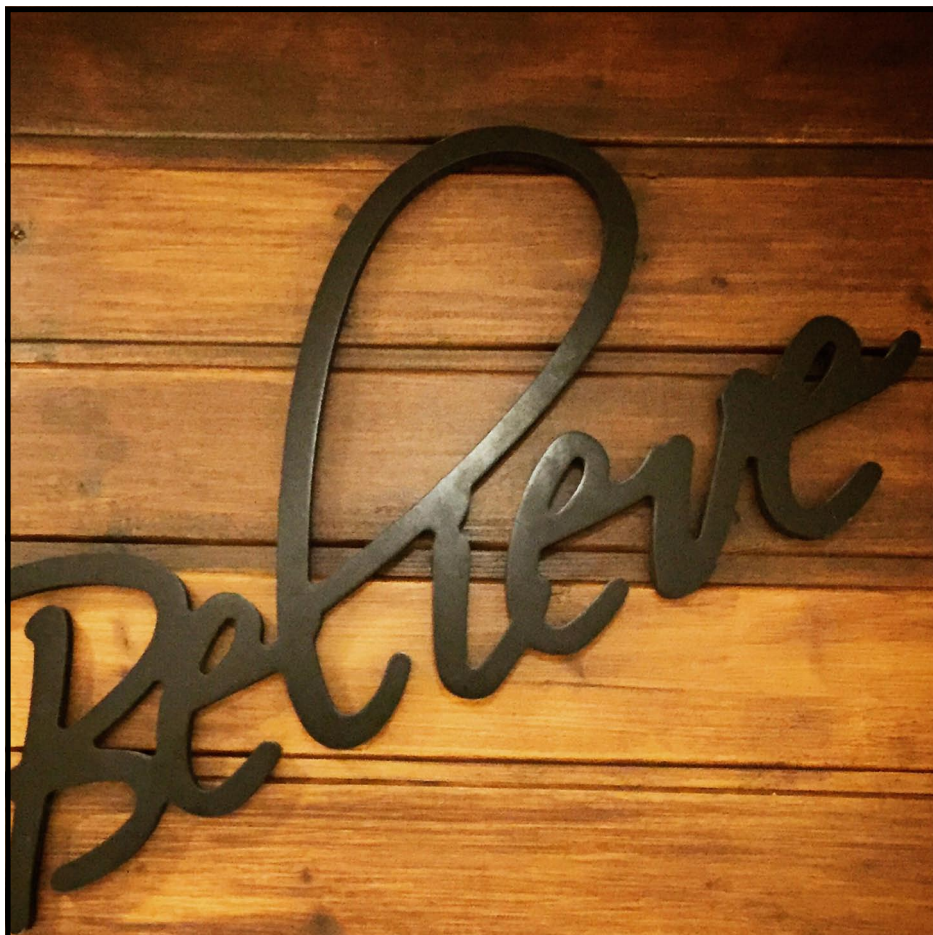
Всичко е възможно, само вярвай!

„Защото чрез дадената ми благодат казвам на всеки един измежду вас да не мисли по-високо, отколкото трябва да мисли, а да внимава да е разумен, според мярката на вярата, която Бог е разпределил на всеки”. (Римл. 12:3)