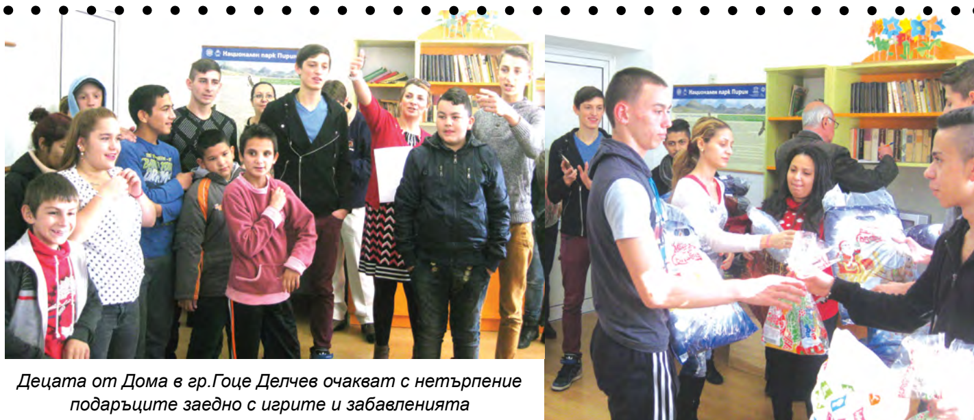
Децата от Дома в гр.Гоце Делчев очакват с нетърпение подаръците заедно с игрите и забавленията