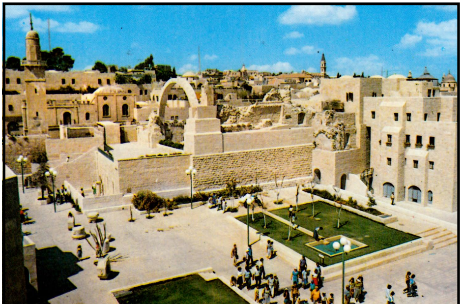
Йерусалим - старият град

„С вяра Йосиф, на умирање, спомена за излизането на израил-