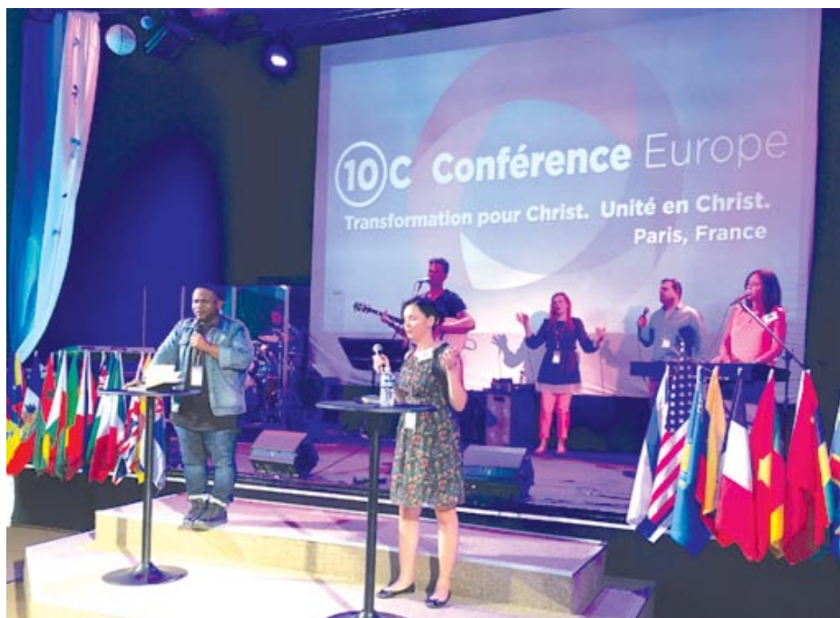
С песни и музика всички хвалят Бога

И така през месец май, от 26 до 29 се събрахме в Париж, Франция, служители от САЩ, Белгия, Финландия, Холандия, Англия, Гърция, Кипър, Южна Африка и голяма група от България. Дните минаха в молитва и поклонение. Париж е разделен на 5 зони. Оказа се, че църквата домакин се намира във 2-ра зона на Париж, близо до центъра на града. Хората, които живеят в този квартал с размерите на град, са мюсюлмани. Те живеят от социални помощи. Станахме свидетели на голямо морално падение. Често тук са ставали убийства. По улиците се движат на групи само мъже, облечени в типично арабско облекло. Мизерия, носят се лоши миризми от парка. Сградите са с хубава архитектура, но олющени и занемарени. Един ден пред погледа ни разбиха пожарен кран, от който бликна вода. Започнаха да се къпят и родители и деца. Някои от жените донесоха легени. Изпраха дрехи, които простряха на пейките в парка. Тези хора изобщо не са се асоциирали към френското общество. Винаги се молихме, вървейки по улиците до хотела и особено вечер, когато се прибрахме с метрото. Бог да