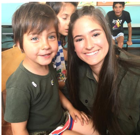
Иисус обича децата! На тях е Божието Царство.