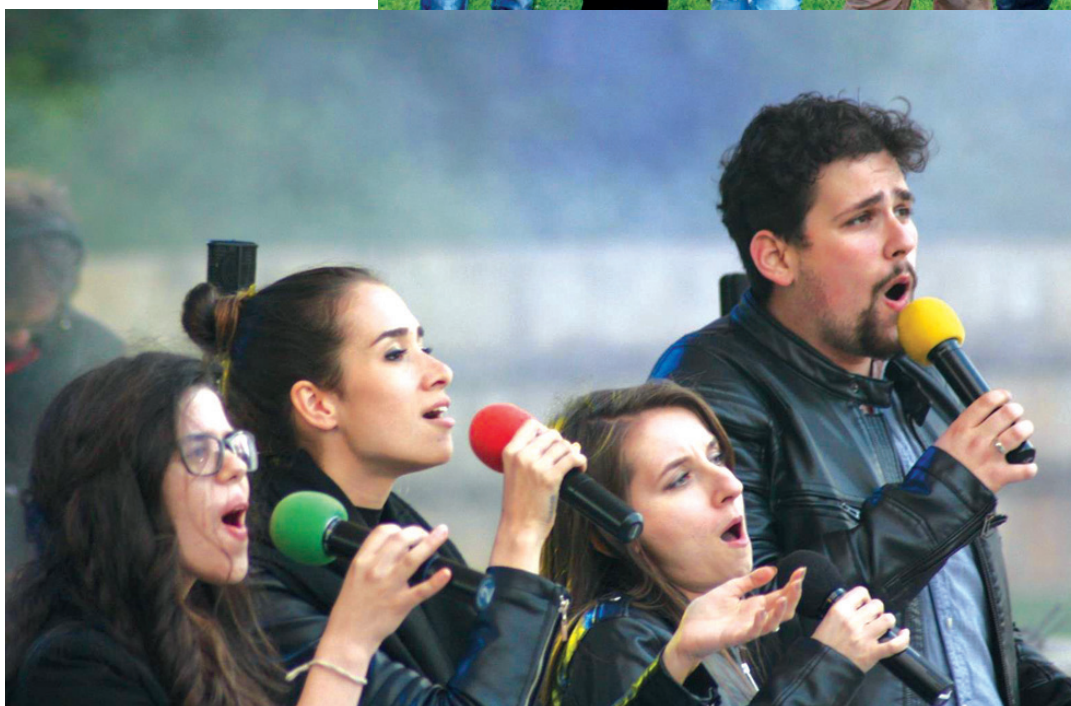
Rev Gen Band - САЩ

Музикантите и певците от страната, САЩ и Гърция дойдоха и повярваха в това, че ще бъдат за благословение на нашия народ със своята музика!