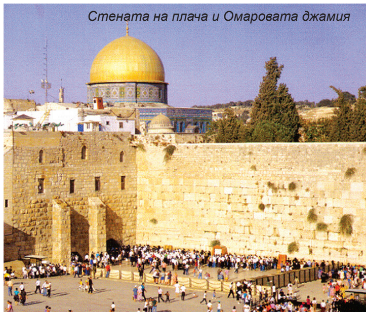
Стената на плача и Омаровата джамия

За мнозина посетители Старият град е Ерусалим. За трите големи монотеистични религии – юдаизма, християнството и ислямът – той е един от най-свещените градове. Прекъсващи масивните градски стени от XVI в., които Сюлейман Великолепни изгражда върху римски руини, осем укрепени порти осигуряват достъп до Стария град. Двете най-важни – Яфеската и Дамаската – въвеждат в един лабиринт от алеи и отличителни гледки, звуци и миризми на четири етнически района и техните пазари: Мюсюлманският (най-големият), Християнският, Арменският и Еврейският квартал. Западната стена (Стената на плача), последната останка от стените, които обграждат и подпират Храмовия хълм и най-свещеното място за молитва в еврейския свят. Опитайте да бъдете тук, когато ортодоксални евреи приветстват Шабат с молитва, песни и танци, докато слънцето залязва всеки петък вечер и то става синагога на открито. Всяка година десетки хиляди християнски поклонници следват Виа Долороза покрай спиранията по Кръстния път, за който се смята, че Христос е извървял, носейки своя кръст за разпъването си на него. Извисяваща се над Разпятието (библейската Голгота), Църквата на Светия гроб е най-свещеното място за християните, тъй като обхваща местата, където Христос е разпънат на кръст, погребан е и е възкръснал.