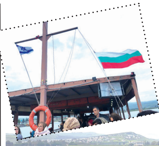
Българският флаг се развява на корабчето „Магента Авраам“ с капитан - българинът Станислав в Галилейското езеро