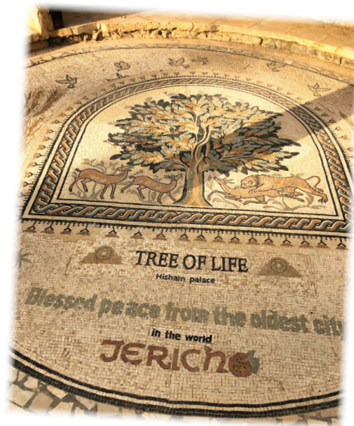
Мозайка „Дървото на живота“ и надпис „Благословен мир от най-стария град в света Ерихон“

Бог дава стъпките на вяра. Не просто да повярваш еднократно, а да ходиш с вяра и да изпълняваш това, което Той иска от тебе. Може да кажеш - няма никаква военна логика във всичките тези действия. Да обикаляш укрепен град, който има в себе си източници на вода, има достатъчно храна да изкара години напред и силна войска. Местните жители са в града, и в оазиса, а израилтяните са в пустинята. В Юдейската пустиня са достатъчни няколко часа без вода, за да се дехидратиращ и умреш през лятото. Господ им даде методологията, която да следват. И тази методология не е логичната. Не е писана от римски пълководци и няма да