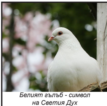
Белият гълъб - символ на Светия Дух

Исус каза това, говорейки за Святия Дух. Не само ще пиеш, а ще станеш извор. Не само ще станеш извор, но ще напояваш други извори. И като напояваш други потоци те ще станат извори. Жената отиде в града и каза: „Елате да видите Един, Който ми каза всичко. Да не би Той да е Месията?“ Дойдоха