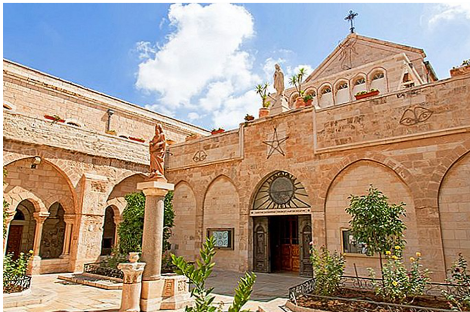
Витлеемската църква „Рождество Христово“

Родината на тази песен е Бавария (1818 г.). Поетът Йосиф Моор бил свещеник в Обернсдорф, а композиторът - негов приятел, учителят Франц Грубер - органист в църквата.