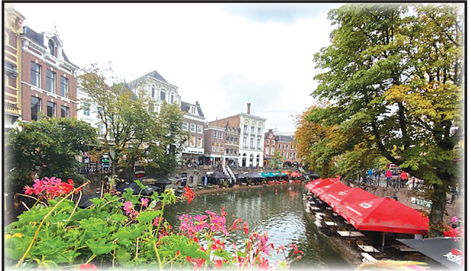
Чистата вода е живот, здраве, храна, отдих, енергия...

Водата е химично съединение, което при стайна температура представлява прозрачна течност без мирис и цвят. Покрива около 71% от повърхността на планетата Земя — 97% е солена морска вода, 2,4% се съдържа в ледниците, а 0,6% в реките и езерата.