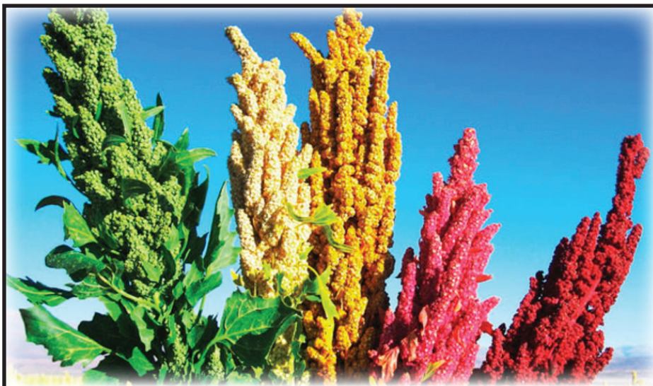
Киноа – най-богатият източник на калций

Някои от ползите за здравето от киноа включват намаляване на риска от диабет, лош холестерол и сърдечно-съдови заболявания, както и за контрол на апетита, увеличаване на приема на антиоксиданти, както и подобряване на храносмилателната система. Киноа е древна зърнена култура, която се отглежда по протежение на Андите през последните 7000 години. Растението се отглежда на големи височини, вариращи между 2,000-4,000 метра в Андите, където всяка година императорът на инките обичайно е посявал първите семена.