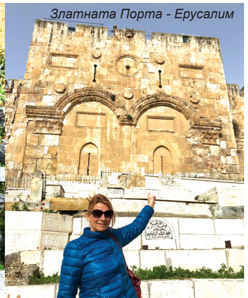
Златната Порта - Ерусалим

ИИСУС ВЪЗКРЪСНА! ИИСУС ще се ВЪРНЕ отново!