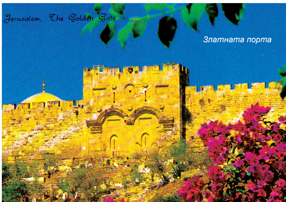
Jerusalem. The Golden Gate

Златната порта била зазидана чак по времето на сұлтан Сюлейман Велики Δ от сѳеверие Δ за да не се свъдне вярването на християните, че в Съдния ден през тези порти ще влезе отново Спасителят. И тъй като евреите все още очакват Месия, пред Златната порта е най-скъпо струващото гробище в света.