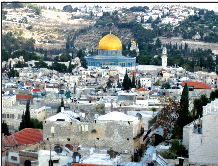
Изглед на стария град Ерусалим от така наречената Давидова кула. Виждат се хълмът на храма (хълмът Мория) и зад него Елеонският хълм

Йерусалим или Ерусалим е град в източен Израел, административен център на Йерусалимски окръг. Разположен на плато в Юдейските планини между Средиземно и Мъртво море, Йерусалим е един от най-древните градове в света и е смятан за свещен от трите главни авраамически религии – юдаизъм, християнство и ислям.