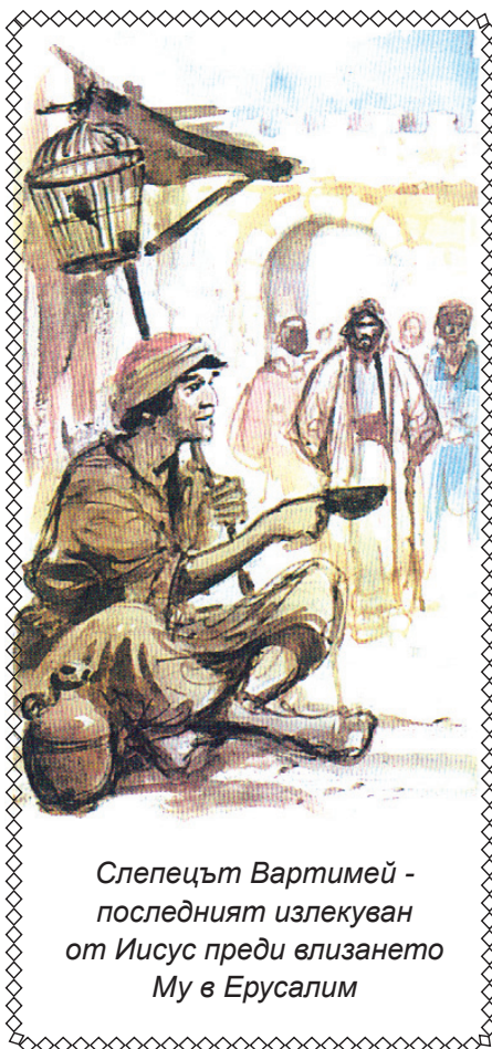
Слепецът Вартимей - последният излекуван от Иисус преди влизането Му в Ерусалим

Вартимей съзря Иисуса като Спасител. Съзря Неговата любов и вяроност. И поиска това, от което