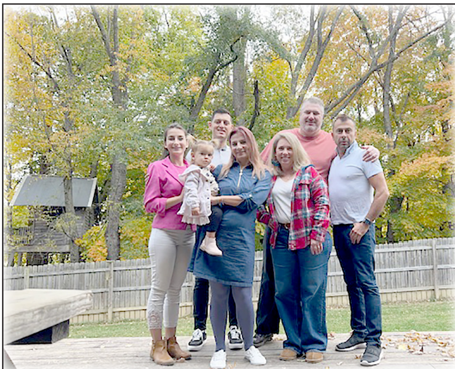
Заедно с п-р Майкъл (горе вдясно) и съпругата му. Той е Божий служител с помазано от Духа национално и международно служение в Пакистан (има телевизионно предаване) и в Африка.