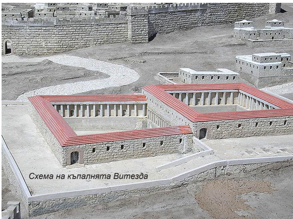
Схема на къпалнята Витезда

Чудотворни икони, талисмани за здраве, парчета от кръста