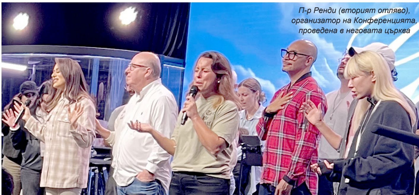
П-р Ренди (вторият отляво), организатор на Конференцията, проведена в неговата църква

Както някога в Ранноапостолската църква: "И внезапно стана шум от небето като