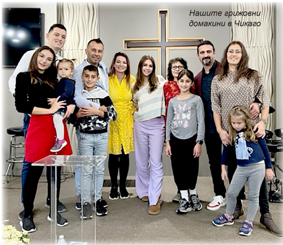
Нашите грижовни домакини в Чикаго