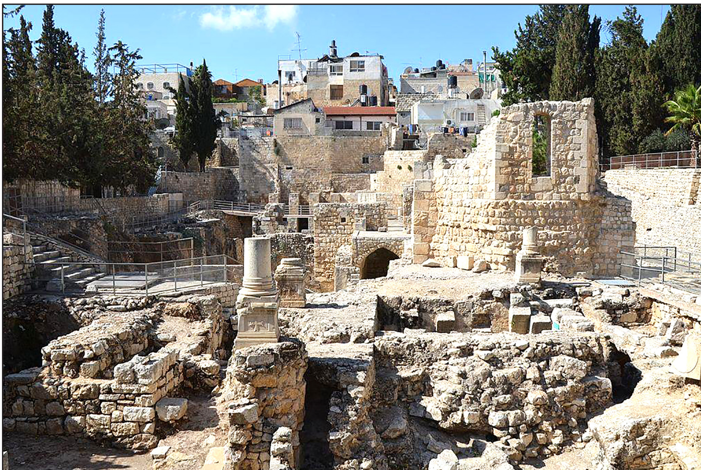
Йерусалим, днешна Витезда – археологически разкопки

басейна, плюс пета централна колонада, който разделя басейна на две. Можете също така да видите Овчата порта , водеща към града, в горния ляв ъгъл на изображението.