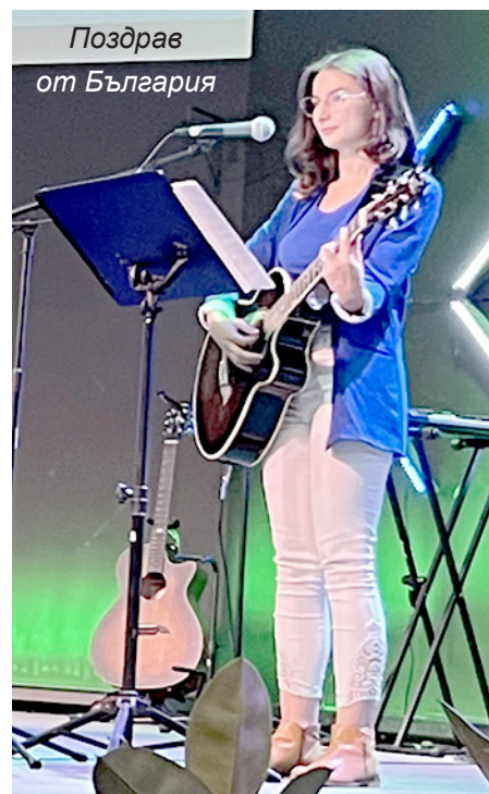
Поздрав от България