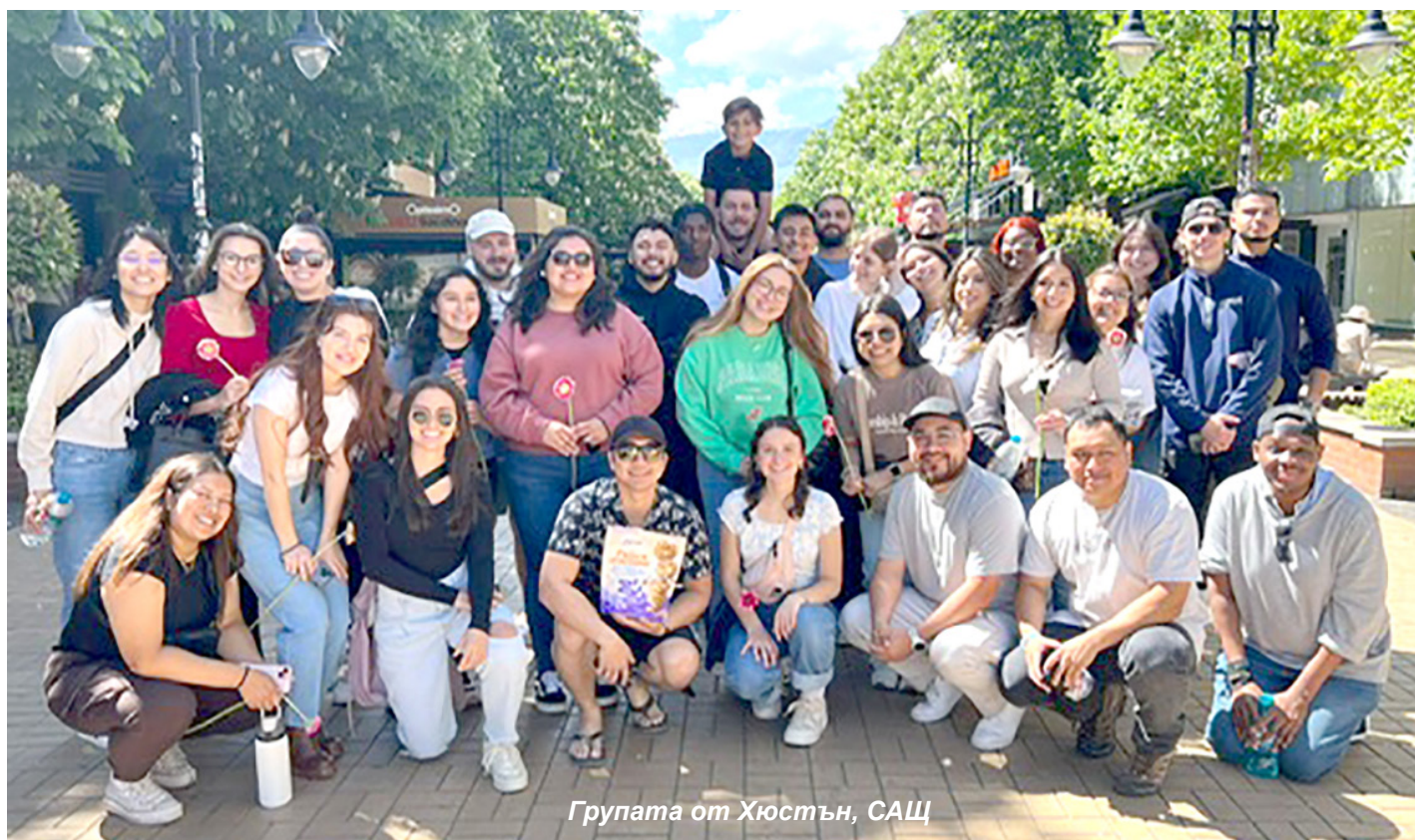
Група от Хюстън, САЩ

Посрещнахме ги с 5 микробуса. На следващия ден гостите, придружени от пастор Владо, Буба и екип от църквата "Дом на радост", общо 42 човека, тръгнахме на турне в различни градове.