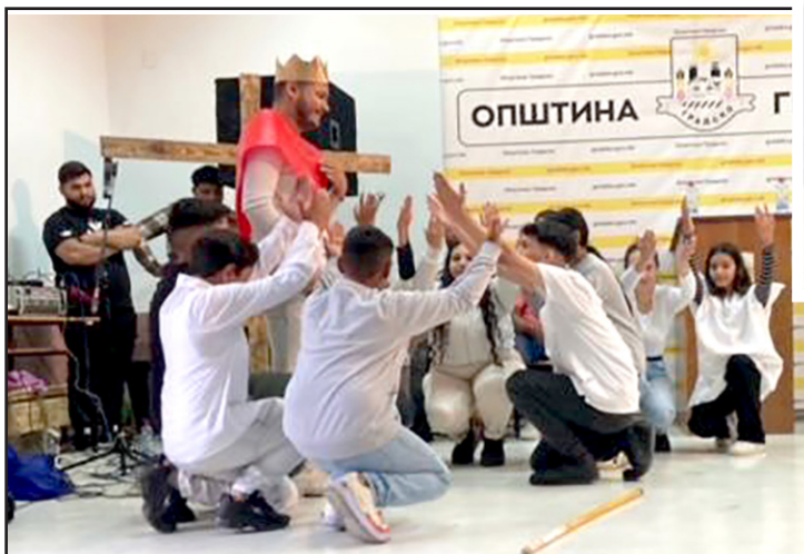
Младежи в Градско представят живота на Исус с театрална постановка